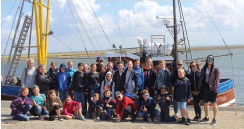
Aus rechtlichen Gründen sind weitere Bilder nur im gedruckten Gemeindebrief.